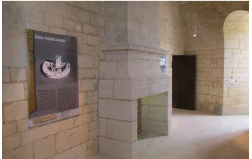
Intérieur du donjon

Le donjon s'élève sur 3 niveaux par un escalier en vis de 87 marches. Au rez-de-chaussée, une galerie dessert les latrines, un magasin à munition et une poudrière. Les étages sont réservés aux appartements des officiers et du Commandant. La plateforme d'artillerie à 24 mètres de haut offre une vue panoramique sur le coureau d'Oléron avec tables d'orientation entre chaque créneau. Une exposition chrono-thématique présente l'histoire du fort de sa construction à nos jours.