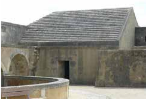
Magasin à poudre

Sur les remparts, deux canons de 24 sont montés sur affûts en chêne. A l'opposé du corps de garde, se trouve le magasin à poudre principal. Il abrite le moule de la sculpture du blason de Louis XIV.