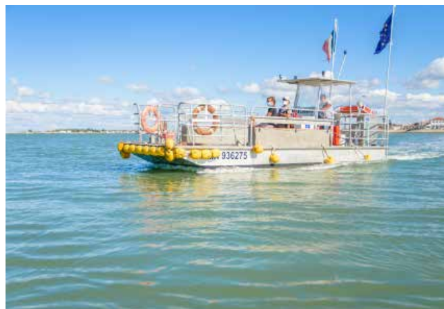
Navette «le Louvois»

À marée basse , on accède au fort à pied en 10 minutes par une chaussée pavée de 400 mètres . L'amplitude d'accès est de 3 heures en moyenne selon le coefficient de marée.