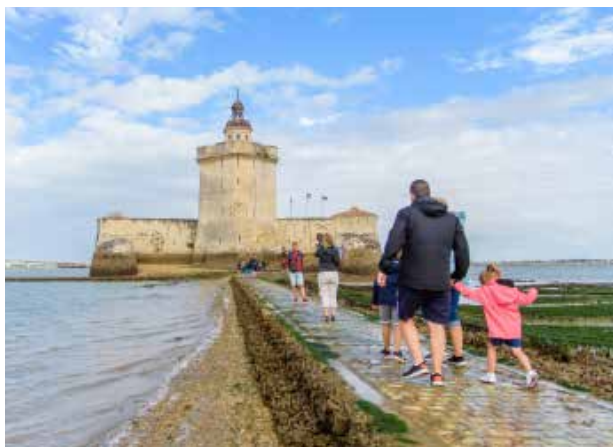
Le fort à marée basse

À marée basse , on accède au fort à pied en 10 minutes par une chaussée pavée de 400 mètres . L'amplitude d'accès est de 3 heures en moyenne selon le coefficient de marée.