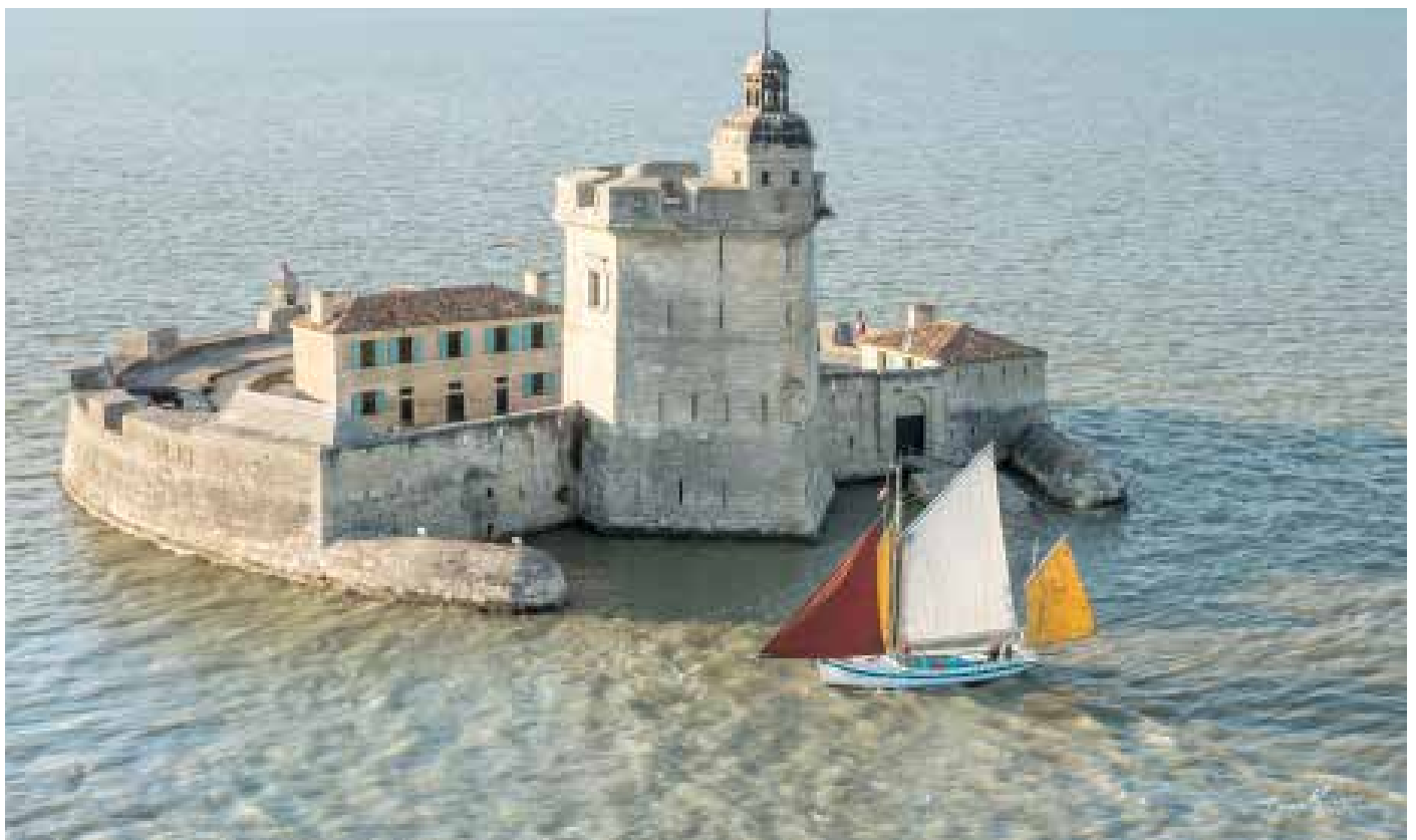
Crédit photo : Laurent Pétillon, Thierry Richard, Kivog Events. Malvina Millerand Crédit dessin Ratastrophe : Jordan Gentes - © Fort Louvois - Janvier 2024.