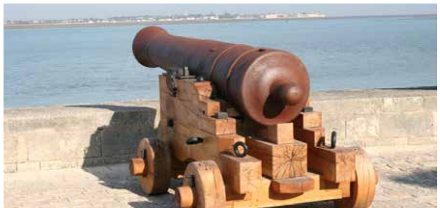
Canon de 24 livres